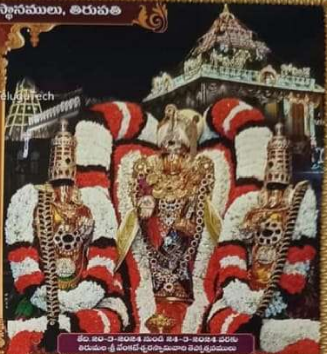
శం. 20-0-2024 నుండి 24-0-2024 వరకు తిరుమల శ్రీ వేంకటేశ్వరస్వామివారి తెచ్చిన ప్రార్థనములు

స్వస్తి-శ్రీ ఛాంద్రమాస-శ్రీ శోభాకృత్ నామ సంవత్సరం మాఘ బహుళ షష్ఠి తుక్రవారం నుండి ఫాల్గుణ బహుళ షష్ఠి ఆదివారం వరకు