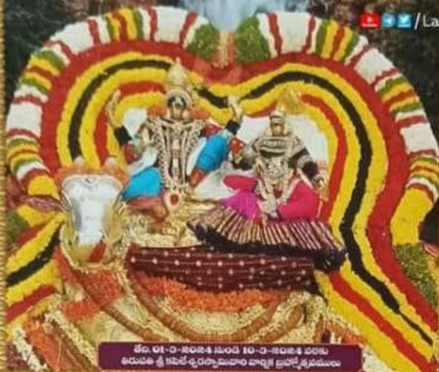
శం. 01-0-2024 నుండి 10-0-2024 వరకు తిరుమల శ్రీ వేంకటేశ్వరస్వామివారి వార్షిక ప్రార్థనములు