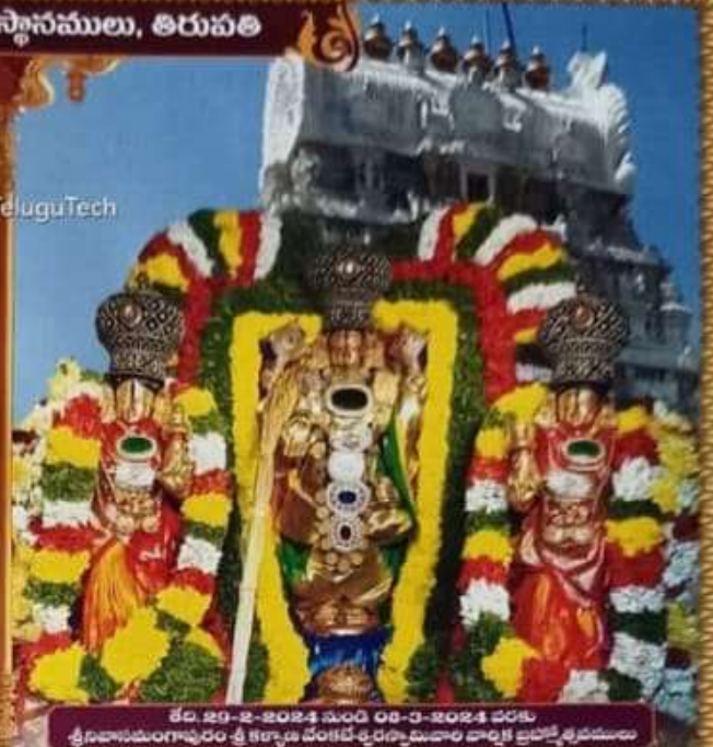
తేది 29-2-2024 నుండి 08-3-2024 వరకు శ్రీనివాససుంగాపురం శ్రీ కళ్యాణ వేంకటేశ్వరస్వామివారి వార్షిక బ్రహ్మోత్సవము