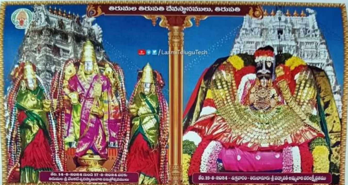
తే. 14-8-2024 నుండి 17-8-2024 వరకు తిరుమల శ్రీ వెంకటేశ్వరస్వామి వారి పవిత్రోత్సవములు