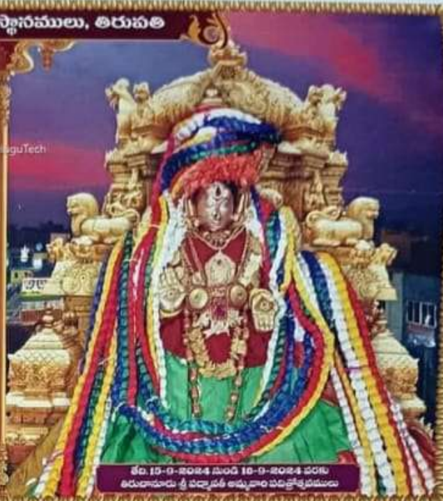
తే. 15-9-2024 నుండి 16-9-2024 వరకు తిరువారు శ్రీ వరాహ ఆస్తులం విధిస్తోంది

స్వస్తి శ్రీ దాండ్రమాన శ్రీ శ్రీధ నామ సంకరా శ్రావణ బహుళ చతుర్దశి అదివారం నుండి భాద్రపద బహుళ శ్రయోదశి సోమవారం వరకు