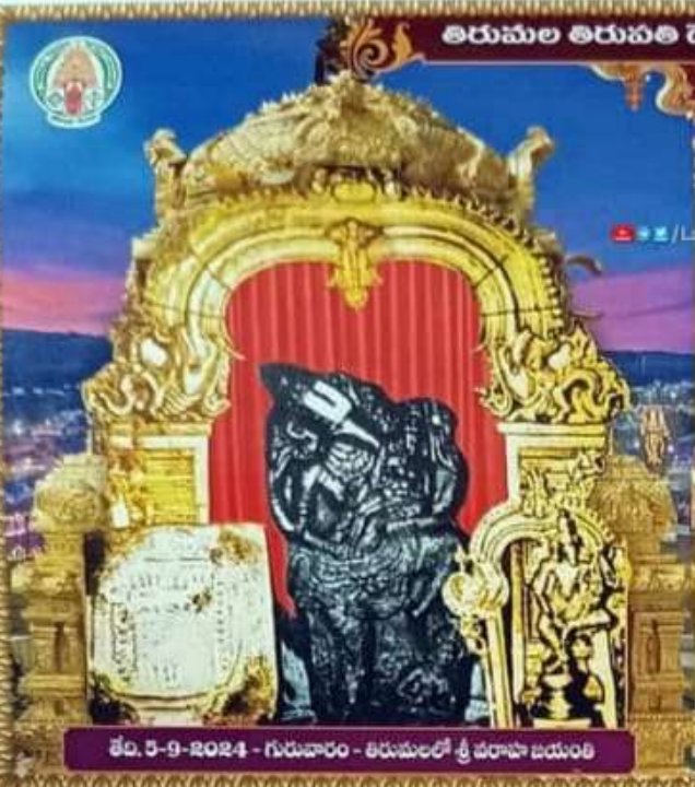
తే. 5-9-2024 - గురువారం - తిరుమలలో శ్రీ వరాహ బయ్యం