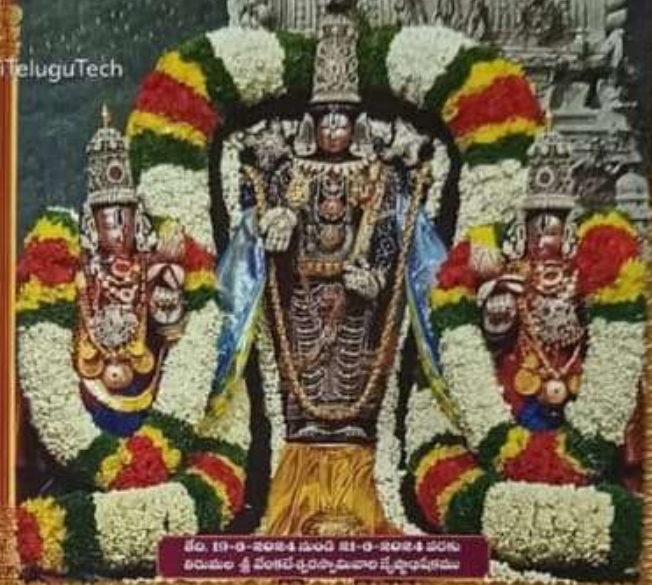
శని. 17-6-2024 నుండి 21-6-2024 వరకు తిరుమల శ్రీ వేణకేశ్వరస్వామివారి క్షేత్రాధిపతి