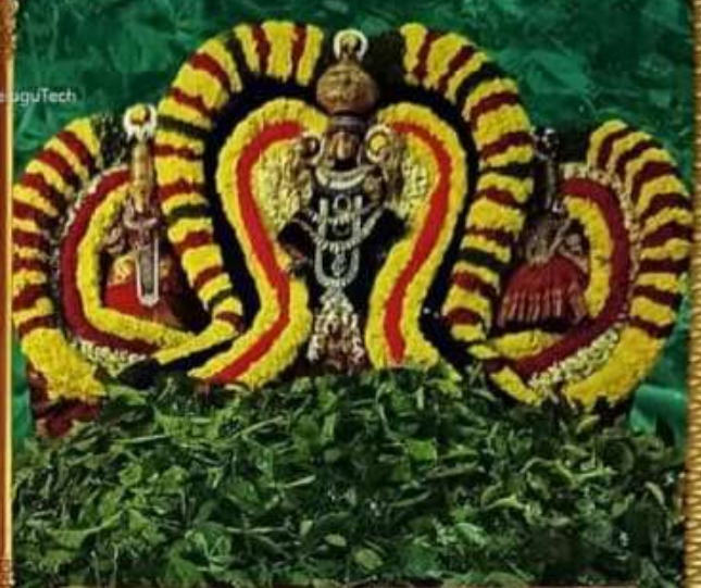
తే. 09-11-2024 - శనివారం - తిరుపతి శ్రీ వేంకటేశ్వరస్వామి వారి లక్ష్మణప్రసాదాలు

స్వస్తి శ్రీ దాండ్లమాప శ్రీ క్రోధ నామ సంకీర్తన అశ్వయుజ బహుళ ఆమావాస్య సుక్రవారం సుందరి కార్తీక బహుళ చతుర్దశి శనివారం వరకు