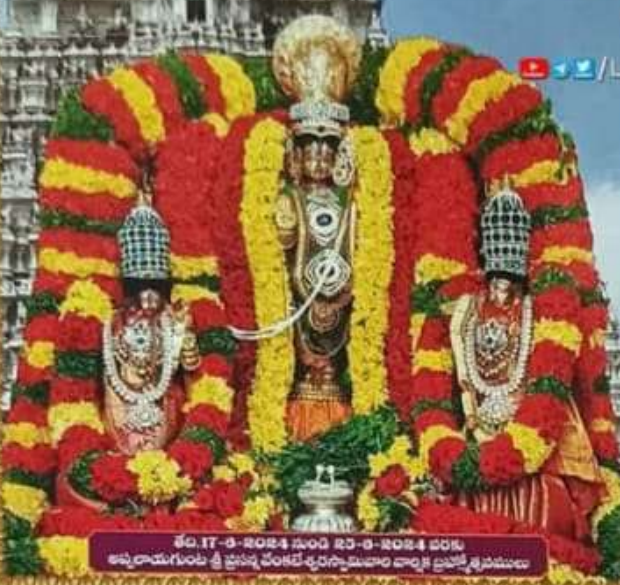
శని. 17-6-2024 నుండి 23-6-2024 వరకు వైశాఖ నామక శనివారం వారం ప్రారంభమవుతుంది