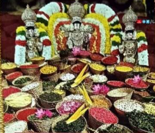
తే. 09-11-2024 - శనివారం - తిరుమల శ్రీ వేంకటేశ్వరస్వామి వారి ప్రసాదాలు