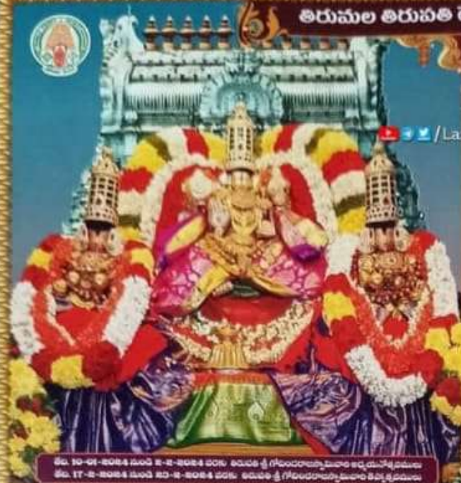
తేది 10-01-2024 నుండి 2-2-2024 వరకు, తిరుపతి శ్రీ గోవిందరాజస్వామివారి కంచుకొండవరము తేది 17-2-2024 నుండి 20-2-2024 వరకు, తిరుపతి శ్రీ గోవిందరాజస్వామివారి కంచుకొండవరము